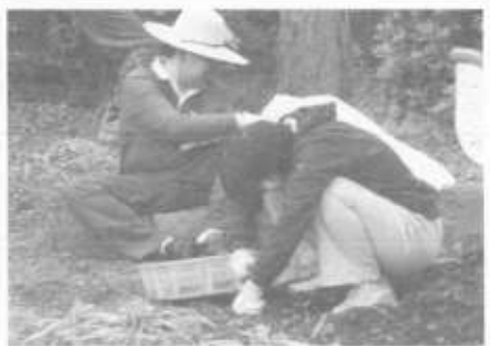
ワーキンググループ 公園除草作業の様子

故も減り生産性もアップしてきています。作業所の使命である仕事を通して就労系平均工賃5万円を目指して今後も努力していきます。