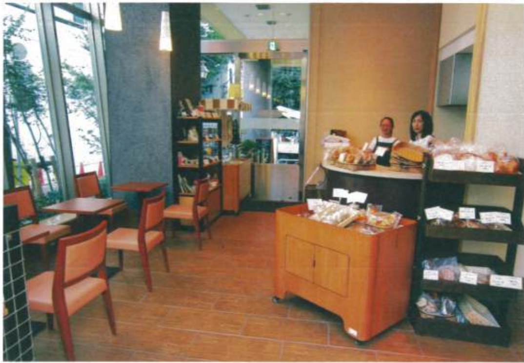
目黒区立目黒本町福祉工房1階 福祉ショップさんまるしえ 6月25日オープン