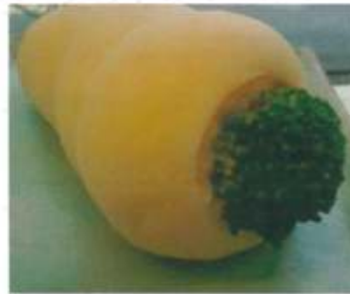
ホワイトジャガサラダコロネ 157円

http://itarunopanouentai.blog77.fc2.com/