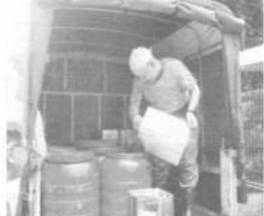
給食廃油回収の様子

す。「原料となる油の回収」については、都内飲食店(のべ40店)の使用済み油の回収に加えて、杉並区内の小・中学校の給食使用済みの油の回収も行っています。杉並区内の小・中学校の回収数は、現在全体の約半数(40校)ですが、来年度には全小・中学校の給食使用済み油の回収の実現に向け、ただ今関係機関と調整中です。また、「BDFの納品」については、最近東日本大震災