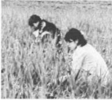
石巻の施設の作業ボラの様子

被災地支援バザー 並区内北西部に活動拠点「杉」を置く障害者団体や地域団体が参加して毎年実施している「夏まつり福祉バザー」において、南相馬支援チャリティーバザーコーナーを設け