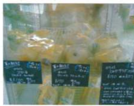
冷やしパン各種 157円～