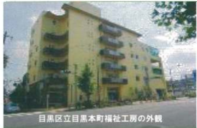
目黒区立目黒本町福祉工房の外観

工賃アップ 6月25日、目黒区からいたるセンターが業務運営委託を受けた福祉ショップがオープンしました。目黒区内にある障害者福祉施設で作られた自主生産品の展示販売と喫茶の提供、その他障害者福祉施設の利用者工賃向上に向けた取り組みを事業内容とするショップです。目黒区内には16の障害者福祉施設があり、その内の14施設から生産品の提供を受けています。自主生産品は食品と物品に分けられます。食品はパン、焼き菓子、おはぎ、おこわ、日替わり弁当等があります。物品は革製品、クラフト製品、スウェーデン刺繍小物、ビーズ小物、キャンドル、陶器、ステンシル布製品等を取り扱っております。喫茶はコーヒー、紅茶、緑茶の他リンゴジュースを提供しています。店舗は目黒通