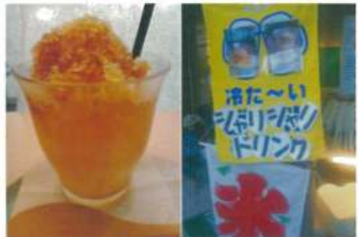
水シャリシャリ(ジンジャー味) 262円