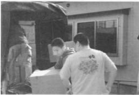
南相馬の施設に支援物資配送の様子

震災直後より、定期的に被災地支援に行っています。6月3日(金)深夜から6月5日(日)早朝まで泊3日で宮城県石巻市湊町方面と福島県南相馬市方面で支援活動を行いました。支援の様子や震災後3カ月後の様子を納めた記録DVDを作成しています。視聴を希望する方は、ご連絡ください。